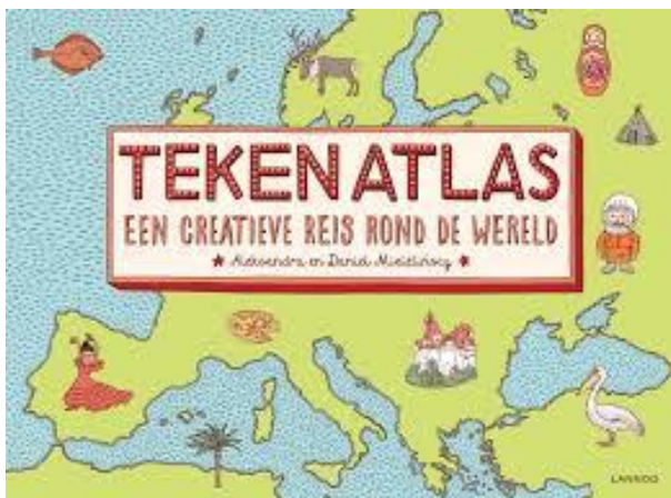
Tekenatlas voor kinderen in gr. 3/4

Eind november heeft Parentes voor groep 3/4b 16 stuks Tekenatlassen van Lannoo gekocht. Waarde € 190,-.