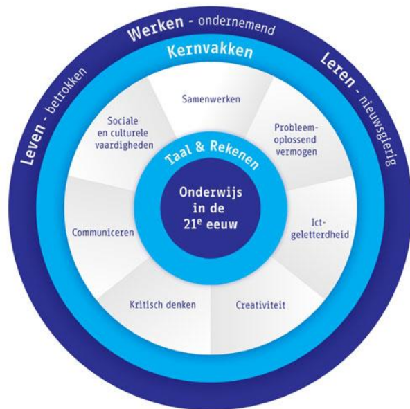
Model ontwikkeld door Kennisnet

De kenmerken van een hoogbegaafd kind komen nagenoeg overeen met bovengenoemde competenties. Kenmerken waarmee deze kinderen vaak in groep 1 van de basisschool al kunnen worden gesignaleerd. Zij zijn dus bij uitstek geschikt om deze eigenschappen te koesteren en verder te ontwikkelen. Met name door deze kinderen al op jonge leeftijd te leren met elkaar samen te werken, zullen zij straks klaar zijn voor de veranderingen in 21 ste eeuw.