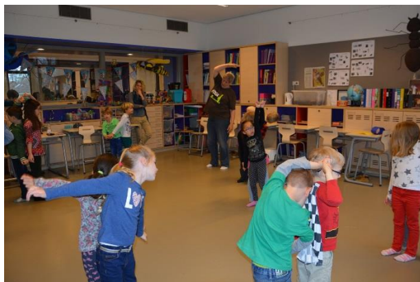
Yogales in gr. 3/4b