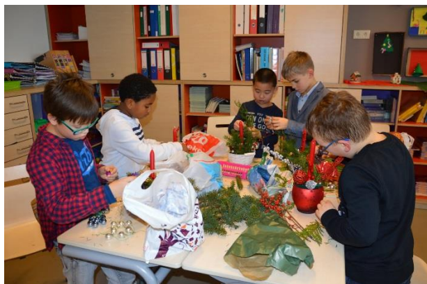
Kerststukje maken gr.3/4b – 5/6b – 7/8b.

De Deltaleerkrachten hebben deze activiteit groepsoverstijgend georganiseerd. Samen met de juffen en de hulpouders hebben de kinderen van de drie Deltaklassen een gezellige, creatieve ochtend beleefd.