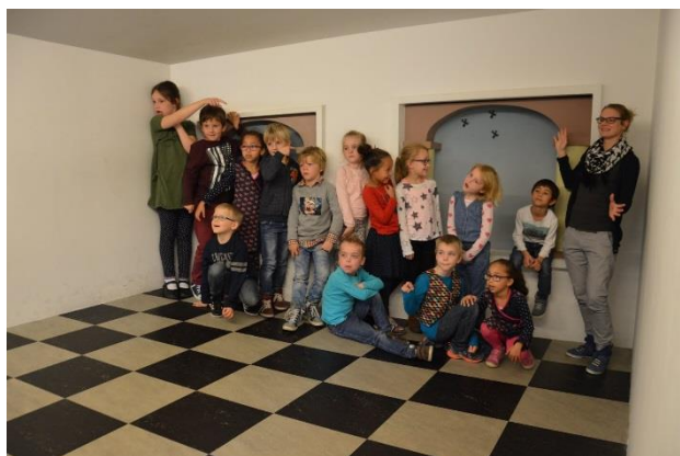
Esschermuseum gr. 3/4